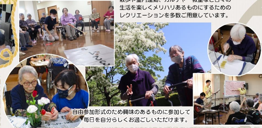
自由参加形式のため興味のあるものに参加して毎日自分らしくお過ごしいただけます。

散歩や室内運動、カルチャー教室など日々の生活を楽しくメリハリあるものにするためのレクリエーションを多数ご用意しています。